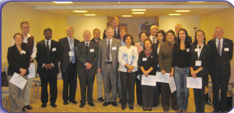
2. Avrupa Board Sınavı komite üyeleri ve başarılı olup sertifikalarını almış olan tüm adaylar.